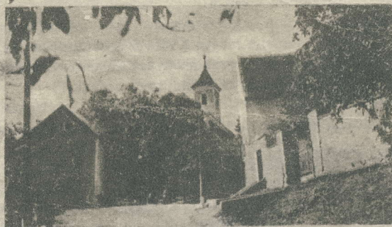
Róm. kat. templom