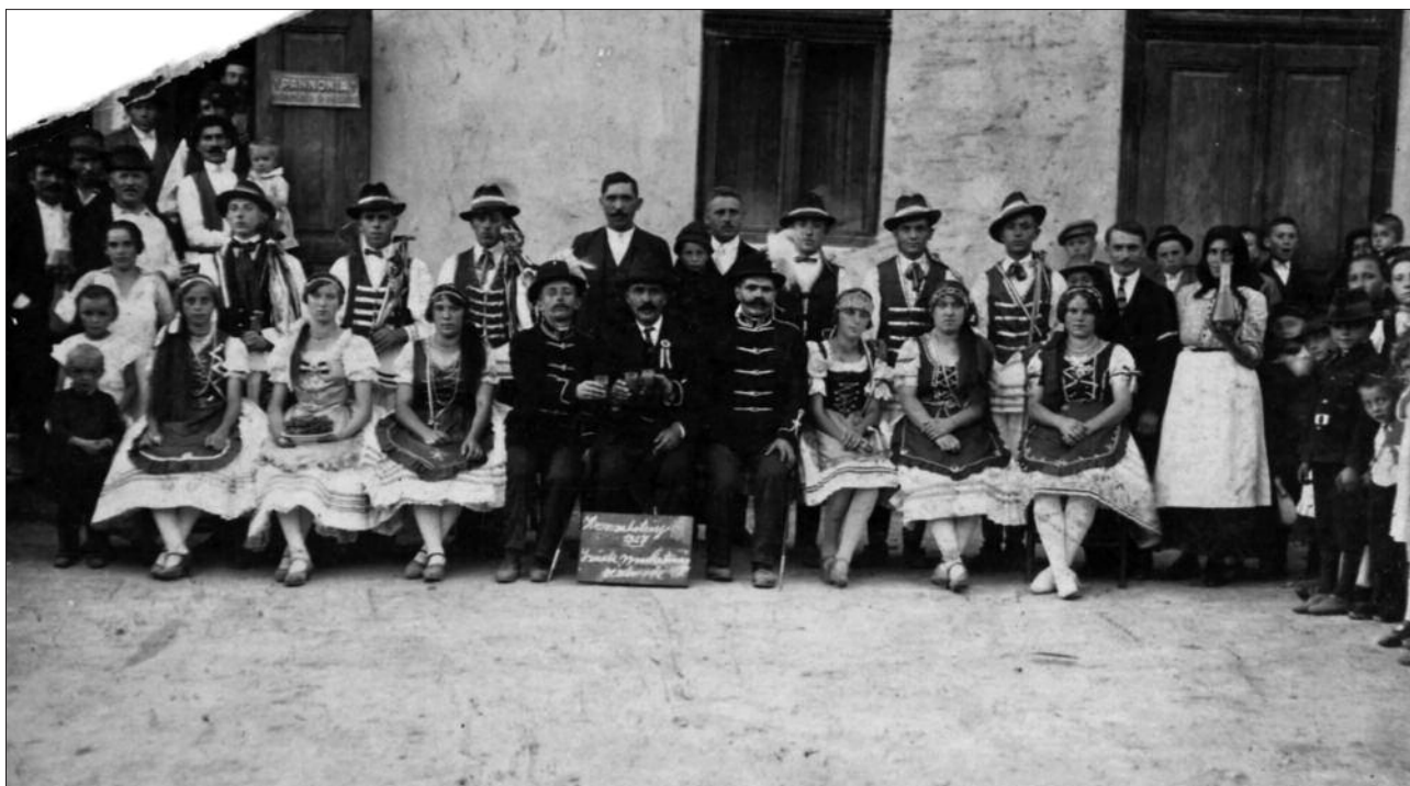
Tépett papírkép 1927-ből. Szüreti mulatság résztvevői az Eckhart kocsmá (korábban Thomatz-vendéglő) előtt.

A plébánia hívei köszönetet mondtak a főpásztor-nak, hogy emlékezetessé tette a szépen felújított templomuk kétszázéves ünnepét.