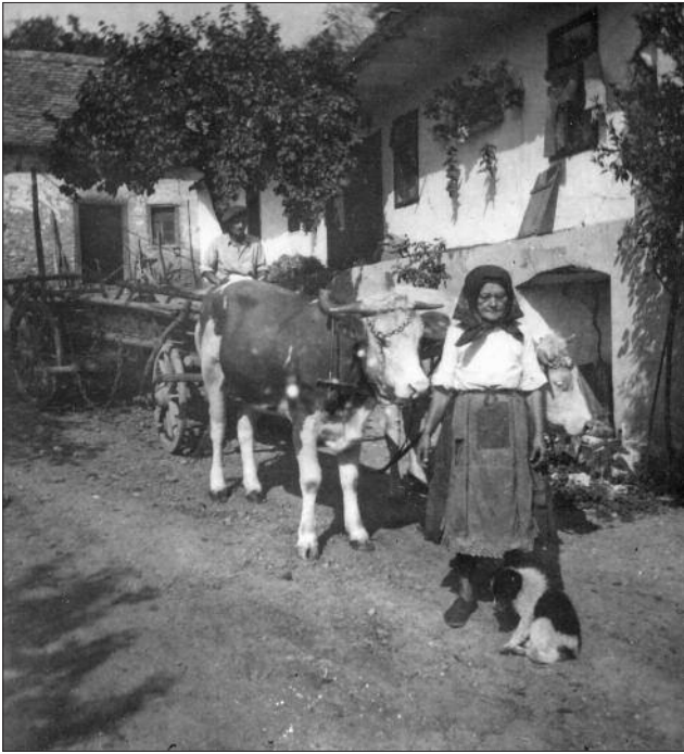
Amikor még tartottak állatokat Hosszúhetényben... Egy tehenes szekér a Petőfi u 5. számú ház udvarán, ahol egykor kovácsműhely is működött. A kép elő-