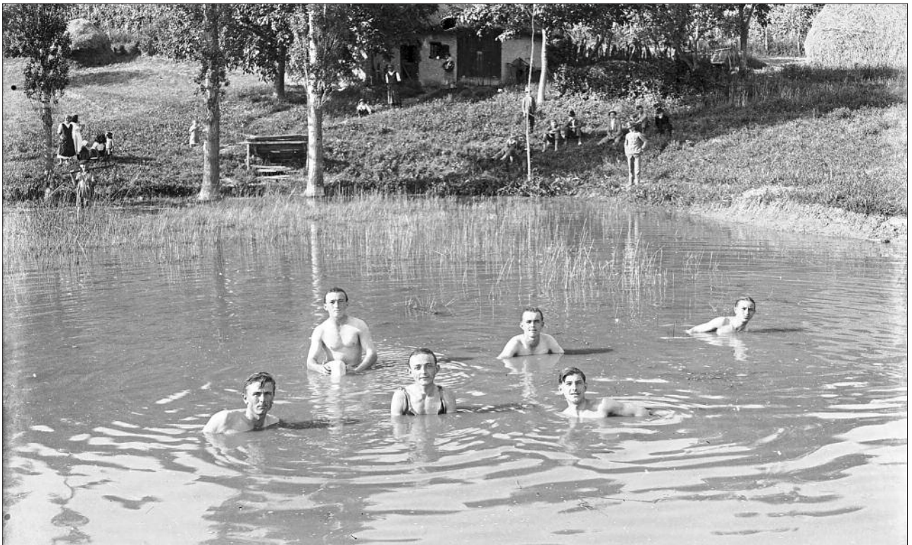
Fürdőzők a strand melletti tóban

A fürdőt nagyon korszerűen, kibetonozott széllel, lépcsőzettel ellátva, és kétoldalt öltözőket alakították ki.