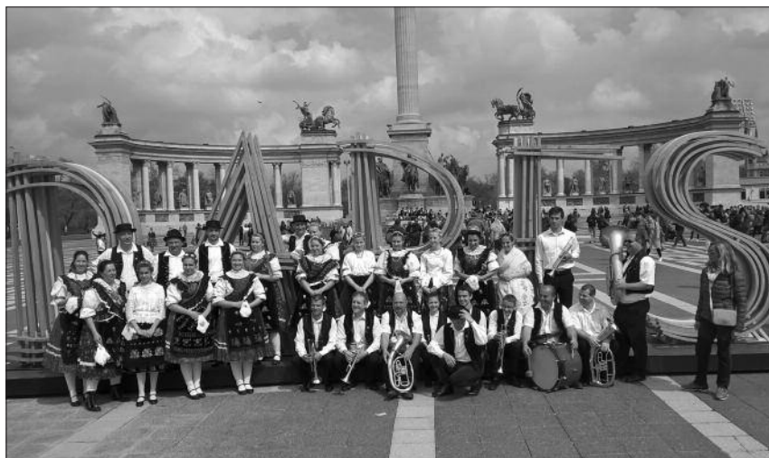
A felvonulás és közös tánc utáni csoportkép a Hősök terén, Budapesten