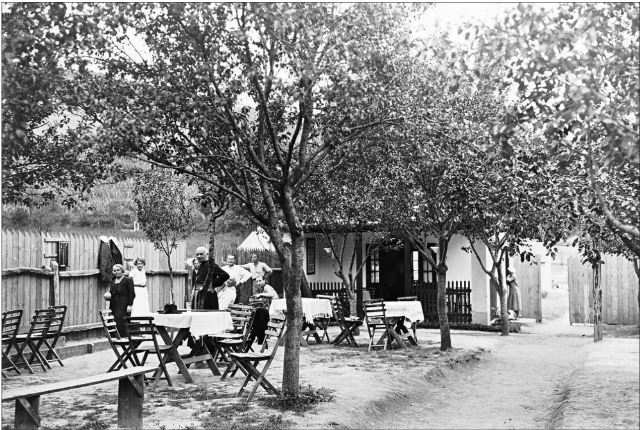
A strandhoz tartozó kerthelyiség a bejárat felől.