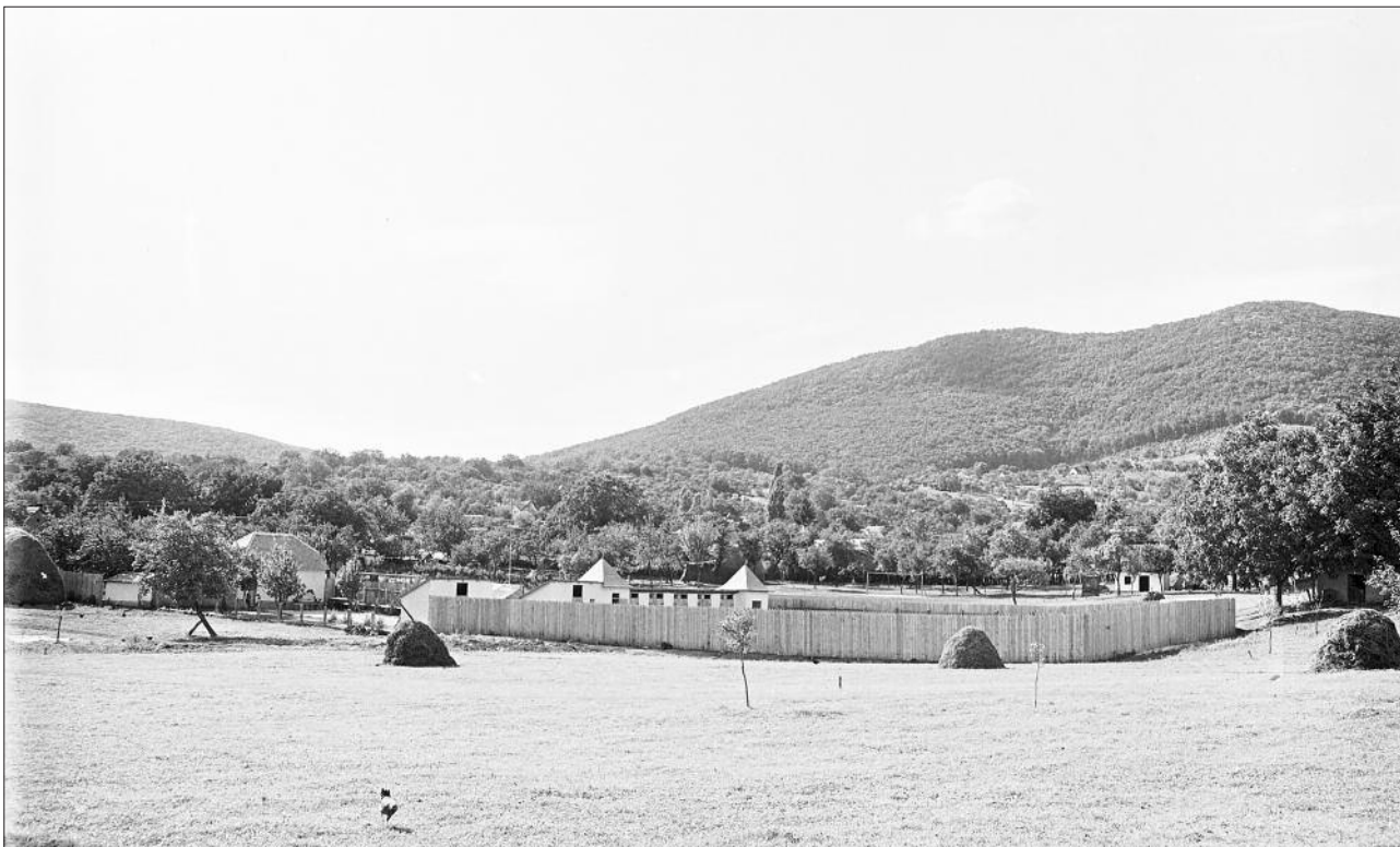
Távlati kép háttérben a Hármashegy