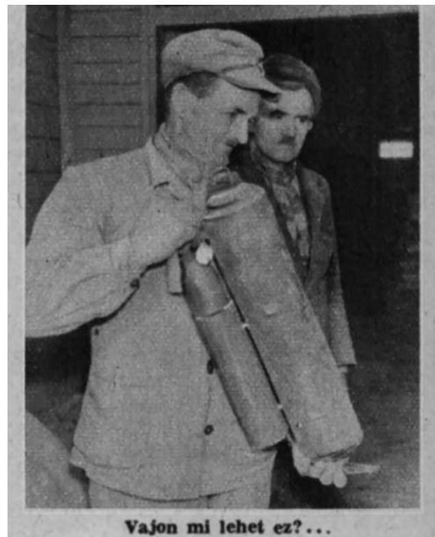
Vajon mi lehet ez?...

A polgármesteri hivatalban őrznek tűzoltó serlegeket a harmincas évekből, és talán előkerülnek még egyéb tárgyak, dokumentumok a helyi tűzoltósággal kapcsolatban, hiszen a fűrészüzemben is működött komoly tűzoltóság a telep megszűntéig. Kérjük olvasóinkat juttasság el a Múltmentőnek a relikviákat, hogy teljesebbé tehessek a a hetényi tűzoltó egyesület 115 éves történetét!