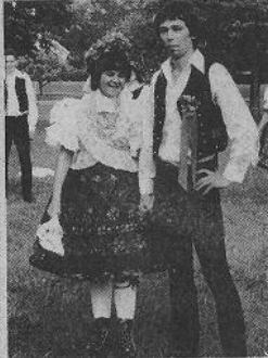
Här hyllas brudparet i det ungerska, lantliga bröllopet.

Till och med regnet kapitulerade inför den ungerska danskonsten när det folkdanslag som denna vecka gästade Skinnskatteberg gjorde sitt första framträdande. Det skedde i Ridderhyttan i onsdagskväll, där hade regnmolnen sökt sig in över premiären på gräsplanen framför kyrkan och just som dansarna sprang ut föll de första, tunga dropparna.