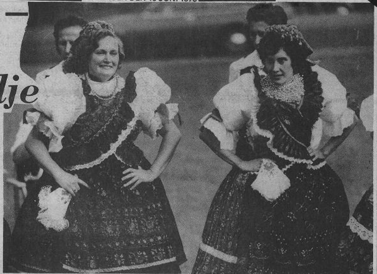
Bara dräkterna är värda ett besök på någon av ungrarnas dansuppträdanden.

Men regnet gav snart upp, bortjagat av färgerna, glädjen och värmen som ungrarna spred omkring sig. Vad man bjuder på är mycket, mycket mer än vad vi vanligen förknippar med folkdans. Med stor or-