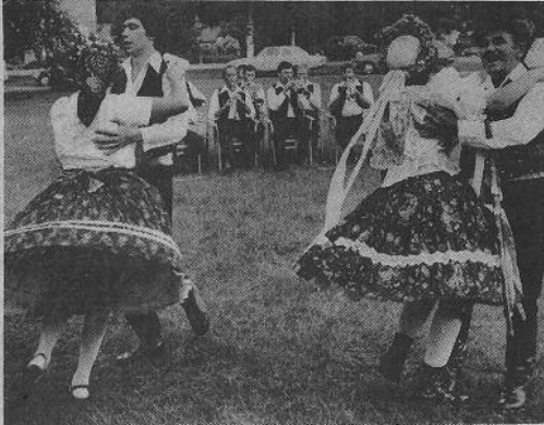
Här träder man bröllopsdansen i den ungerska föreställningen.

kester och hela danstruppen sjungande i danserna, framför man ett lantligt bröllop i Ungern så som det kunde gå till en gång i tiden. Den lilla publiken i Ridderhyttan fick uppleva en härlig mini-operett och alla som missade föreställningen får en ny chans på lördag när ungrarna uppträder vid herrgården i Skinnskatteberg. På söndag dansar de i Söderbärke.