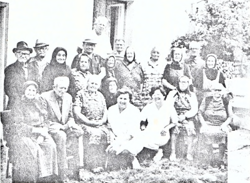
Egy régi kép az otthon lakóival