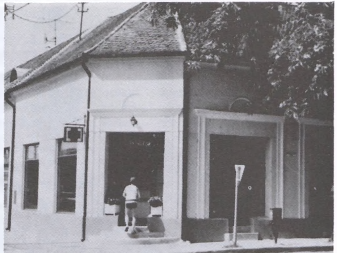
Nyitva hétfőtől péntekig 7.30-16.30 Tel/Fax: 72/465-382