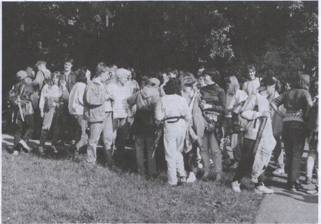
Külsheimi kiránduláson vett részt egy tanulócsoport szeptember elején

szeretném, ha áthatná a honfoglalás ezer éves évfordulójára való készülődés. A hely szelleme kötelez is bennünket erre.