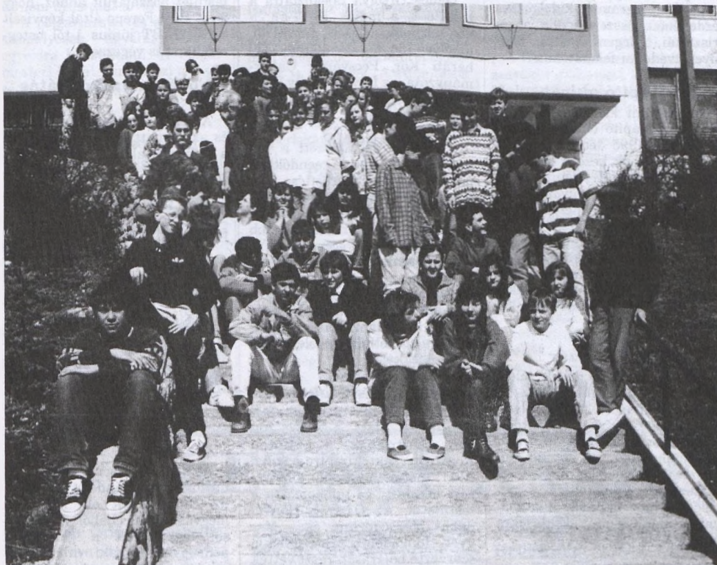
A végzős nyolcadikosok