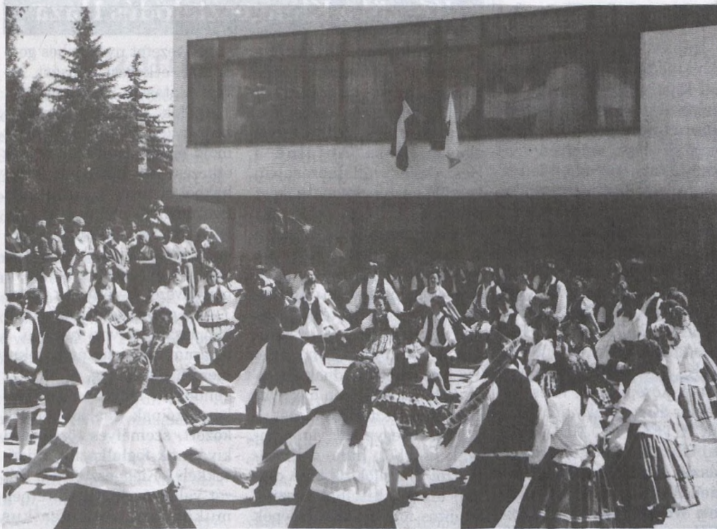
Képünkön a zengővárkonyiak műsoron kívüli fellépése.