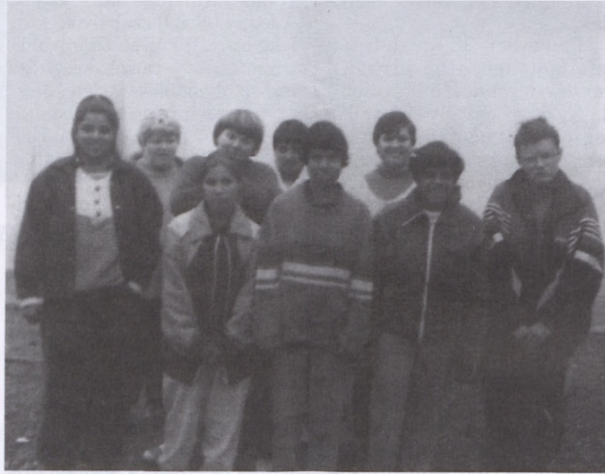
Köszönjük a gyerekek Leányvásár előtti munkáját, a sportcsarnok környékének takarítását és rendbetételét!

den évben részt vehetnek a városunkban megrendezett ifjúsági bérleti hangversenyeken, a Művelődési Házban. A hangversenybérleteket az iskola minden évben megvásárolja a tanulóknak. Az idén több, mint háromszáz iskola - köztük a mi gyerekeink is - hallgatta végig a nagytetszést aratott első hangversenyt. A zeneiskola havonta