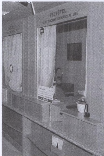
Korszerű technika, kulturált környezet

munkavédelmi igényeket egyaránt biztosító posta kerülhetett kialakításra.