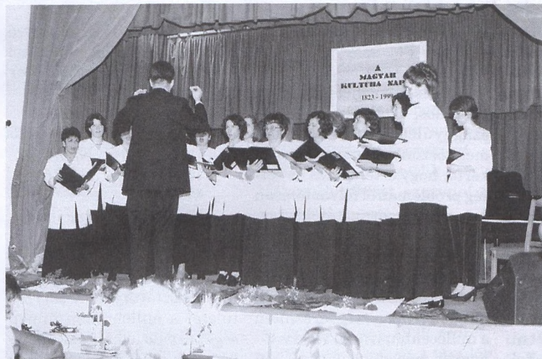
Húsz év munkáját jutalmazták