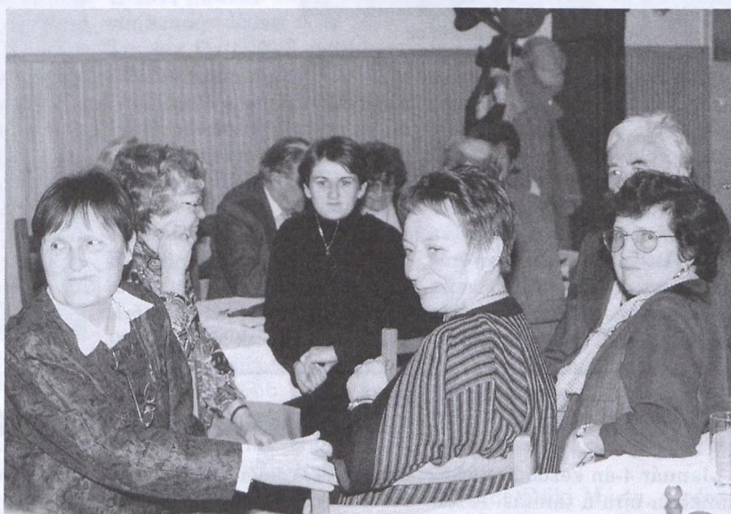
Tartalmas egyesületi élet immár 18 esztendeje