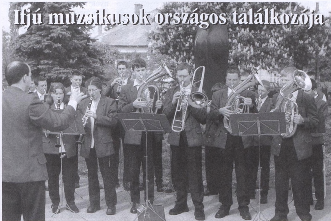
A magyarszéki fúvósok