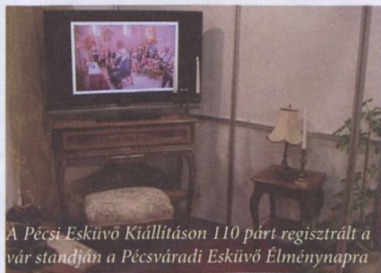
A Pécsi Esküvő Kiállításán 110 párt regisztrált a vár standján a Pécsváradlakosok Esküvő Élménynapra

A szezonnyitó ünnepség kiemelkedő színfoltja a vár termeinek "kelesztelője" lesz: a névadók egytől egyig kötődnek várunkhoz. Másnap, március 3-án a II. Pécsváradlakosok Esküvő Élménynap várja a látogatókat. A tavalyi nagy sikerű rendezvénynek idén a vár ad otthont: 15 szolgáltató (csak helyiek), kóstolók és átalakítások, előadások, látványos programelemek várják nemcsak az esküvőre készülők vendégeket! Természetesen nem marad el a divatbemutató és Esküvői Party sem. 14 órától várjuk az érdeklődőket! Részletes program a plakáton és a www.pecsvaradieskuvo.hu oldalon, ill. a facebookon!