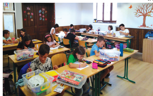
Új osztályterem a volt kultúrház nagytermében

hagyományossá vált pezsgős koccintás követett az iskola udvarán. Ekkor csodálhatták meg először a szülők, a nyári szünet alatt elvégzett munkánk eredményeit, a szépen felújított, új bútorokkal berendezett osztálytermeinket. Köszönjük a zengővárkonyi