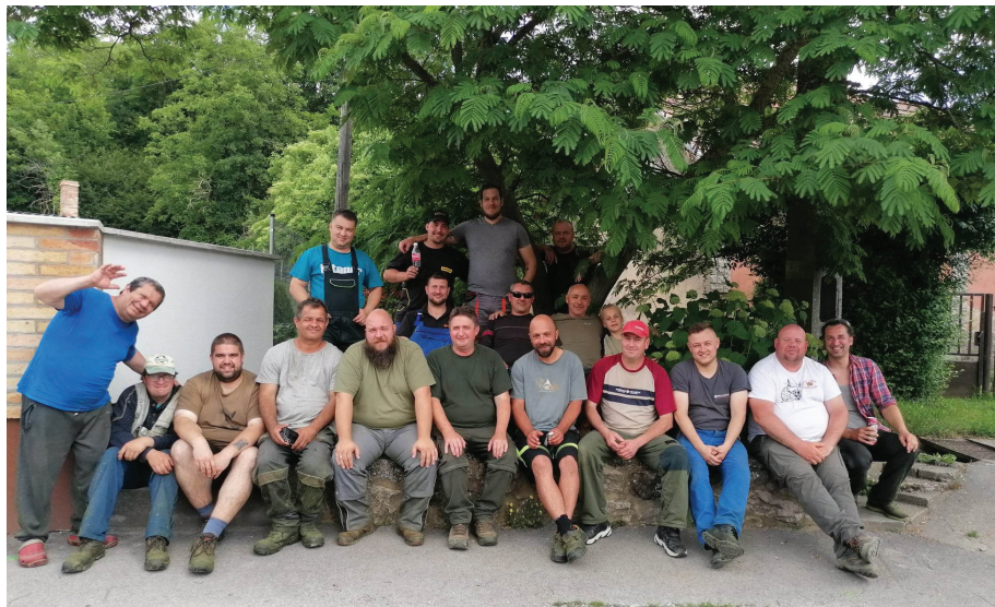
Az önkormányzat által meghirdetett közösségi kaszálás lelkes csapata. Köszönjük a segítséget a teljes közösség nevében!