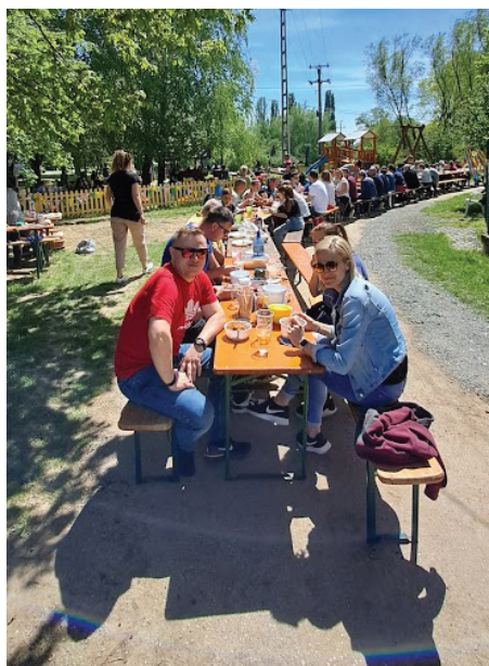
A majálison sok jó ember elért egy asztalnál...egy jó hosszú asztalnál.